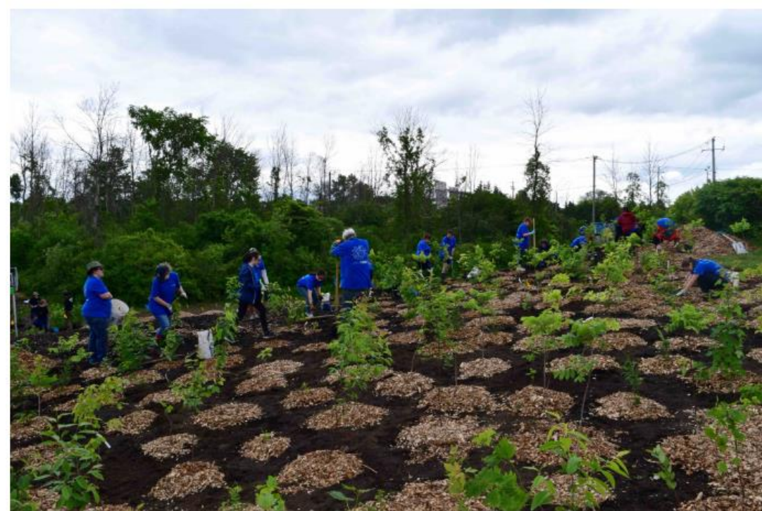
Microforêt de Candiac, planté en 2022.